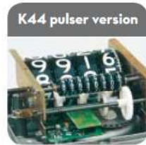
K44 pulser version