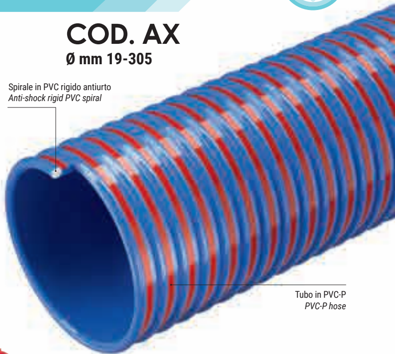
Tubo in PVC-P PVC-P hose

Spirale in PVC rigido antiurto Anti-shock rigid PVC spiral